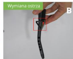
Za pomocą klucza odkręć ostrze