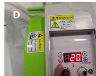
Przytrzymaj wskazany przycisk, aby przewinąć folię manualnie (musi ona przejść przez cały układ i wyjść z drugiej strony)