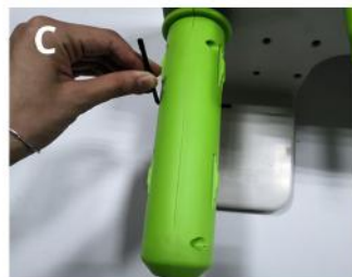
Przykręć wał do maszyny