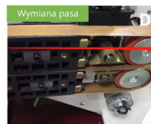
Zainstaluj nowy pas