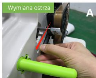
Wyciągnij dyszę powietrzną