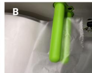
Wsuń początek folii pomiędzy prowadnice