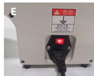
Włącz maszynę naciskając przełącznik (gdy maszyna jest włączona, świeci na czerwono)