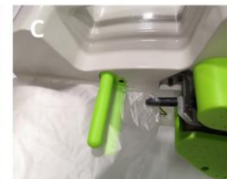
Wsuń początek folii na dyszę z powietrzem