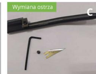
Przykręć nowe ostrze