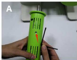
Znajdź odpowiedni klucz sześciokątny