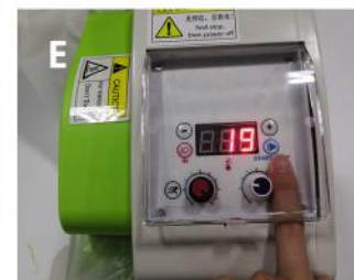
Naciśnij niebieski przycisk (START), aby uruchomić maszynę i zaczekaj, aż się rozgrzeje