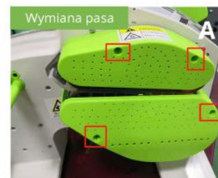
Ściągnij osłonę, odkręć śruby