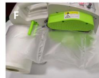
Maszyna zacznie pracę wg wybranych ustawień