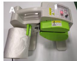
Umieść rolkę z folią na wale