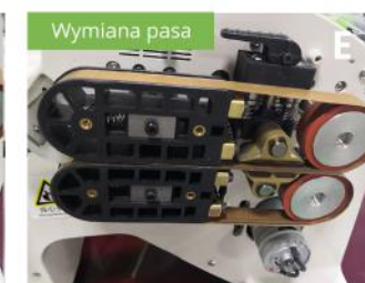
Zamknij zacisk i zamontuj osłonę