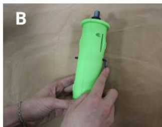
Przełóż klucz przez otwór w wale