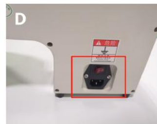
Podłącz kabel zasilający do gniazda