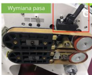
Zwolnij zacisk, podnieś go do góry