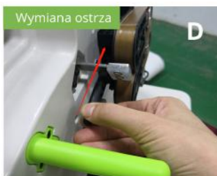
Zamontuj ponownie dyszę