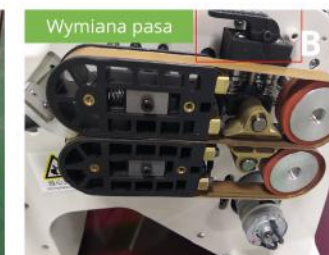
Znajdź zacisk umieszczony na górze